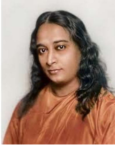
للمعلم برمهنا يوغاندا PARAMAHANSA YOGANANDA ترجمة محمود عباس مسعود